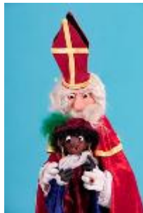
Kindertheater Max Verstappen