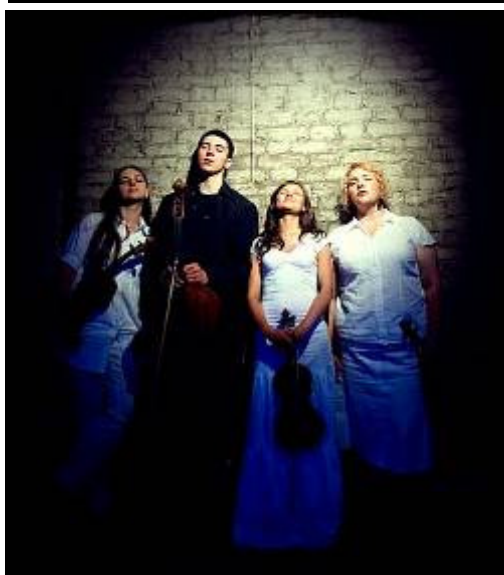
Anima Strijkkwartet St. Petersburg