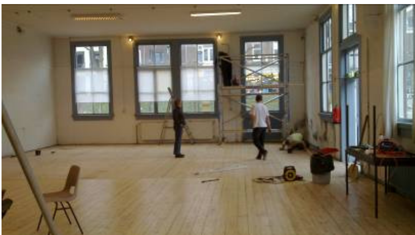
150m2 sociaal-culturele zaal. Vrijwilligers bedankt!